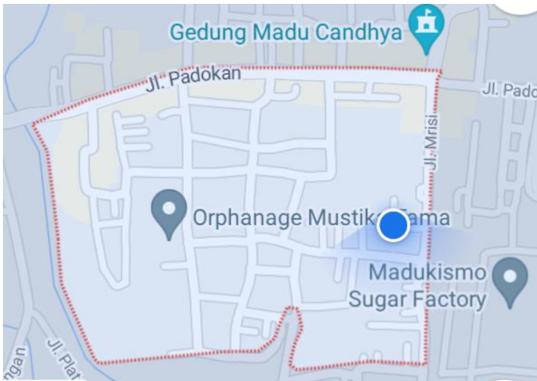
Lampiran 2. Peta Lokasi Wilayah Mitra