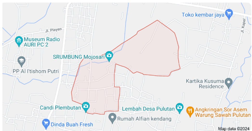
Figure 1. Peta Wilayah Lokasi