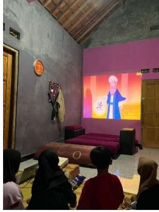
Penyuluhan kesehatan penyakit tidak menular