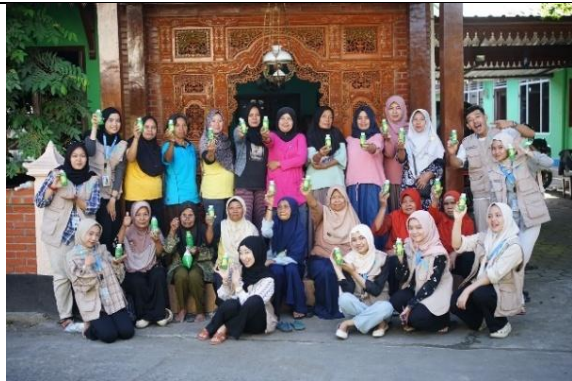
Penanaman TOGA dengan Ecobrick (TOGARICK)