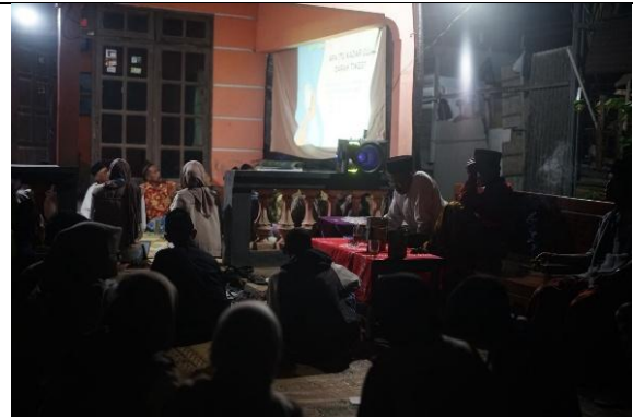
Penyuluhan Kesehatan reproduksi