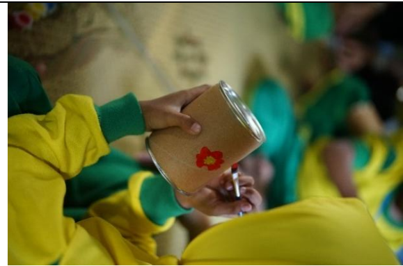
Rumah belajar sore