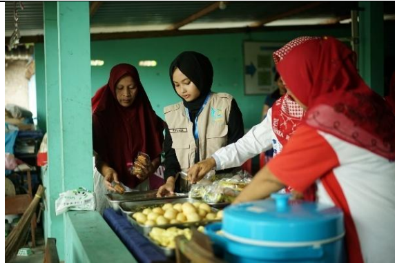
Penyuluhan gizi seimbang dan pemberian PMT