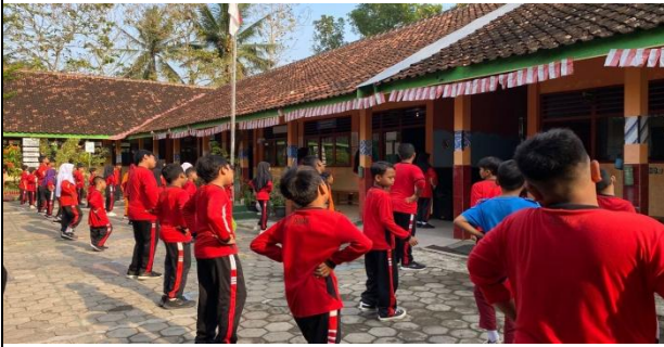
7. lomba 17-an bersama SDN1 kalipetir