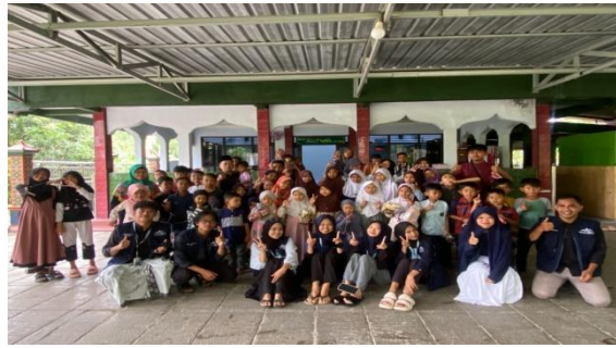
8. Perpisahan dengan TPA dusun Kalisoka