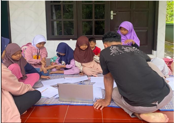
15. Bimbel Gratis