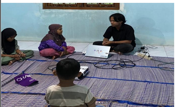
13. Edukasi gadged