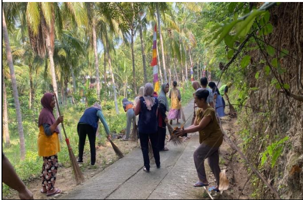
17. Gotong royong