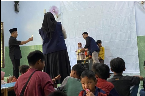
9. TPA Al-Fajar RT 28