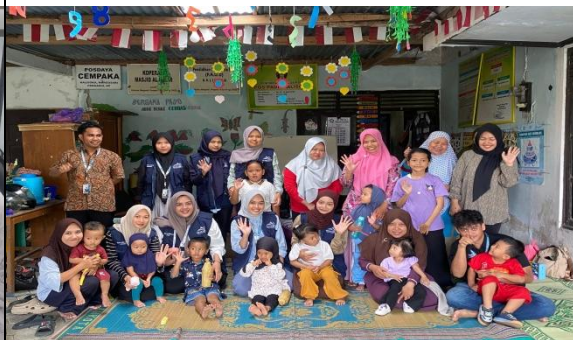
12. Penyuluhan PHBS di PAUD