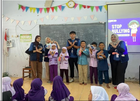
16. penyuluhan Bullying