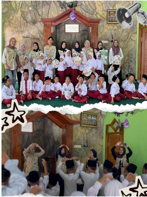
Timkes Semifinal Bola Voli