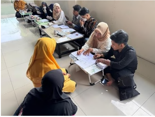
2. Dokumentasi sesi cek tekanan darah/tensi