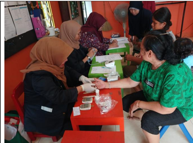
Gambar 1. Pemeriksaan Kesehatan ( TB, BB, Tekanan darah, gula darah dan asam urat