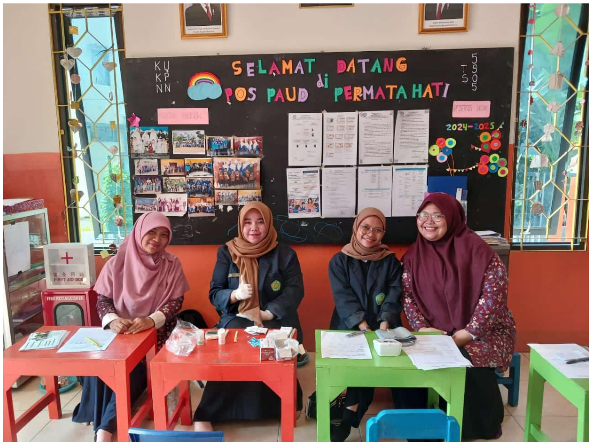
Gambar 3. Tim Pengabdian Masyarakat dari UNISA