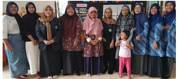
Gambar 2. Tim Pengabdian Masyarakat UNISA Bersama Panitia