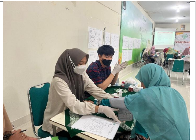
Gambar 2. Pengukuran tekanan darah