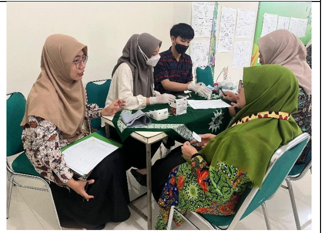
Gambar 4. Konsultasi dan promosi Unisa