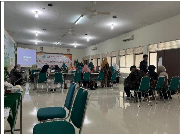
Gambar 1. Acara pembukaan