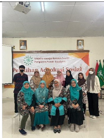
Gambar 5. Foto bersama panitia