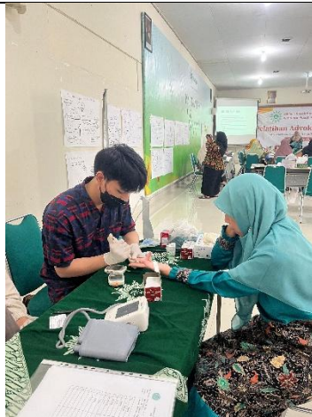
Gambar 3. Pengukuran kolesterol, gula darah dan asam urat