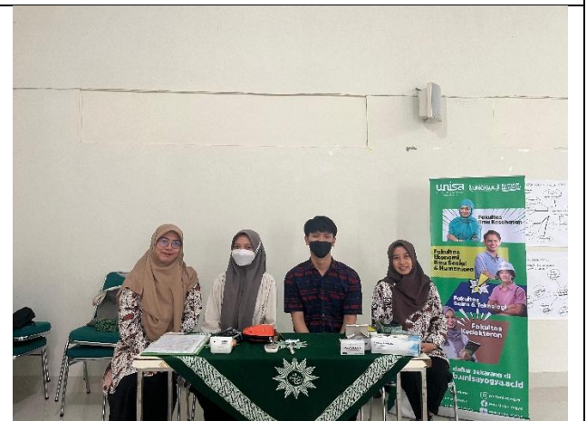
Gambar 6. Tim Kesehatan Unisa