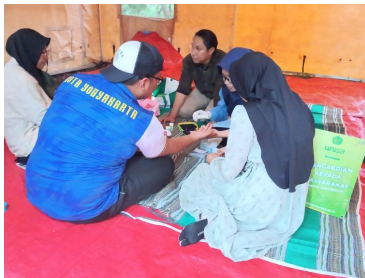
Gambar 1. Tim Kesehatan sedang Mengecek Kondisi Peserta Kemah

Kegiatan pengabdian masyarakat ini dilaksanakan sebagai pendukung kegiatan kemah kader remaja masjid Muhammadiyah se-Kota Yogyakarta yang dilaksanakan di bumi perkemahan Girikaton, Sleman.. Pada kegiatan ini, dilakukan upaya pertolongan pertama pada kecelakaan medis bagi peserta yang memerlukan dan pemeriksaan kesehatan dasar bagi panitia kemah yang menghendaki. Selain itu, kegiatan pengabdian masyarakat juga berkolaborasi dengan tim dari prodi Keperawatan UNISA Yogyakarta sebagai tim siaga kesehatan.