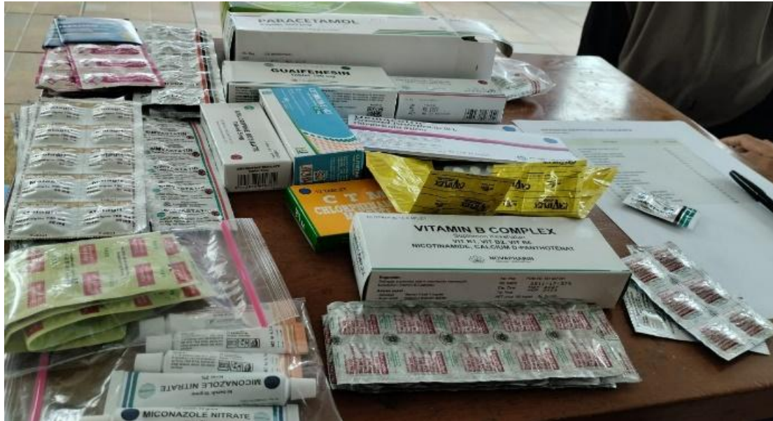
Lampiran 2. Foto Kegiatan Baksis Sosial Pemeriksaan Kesehatan